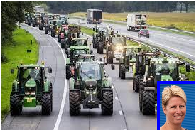
De stikstofcrisis. Hoe komen we er uit?